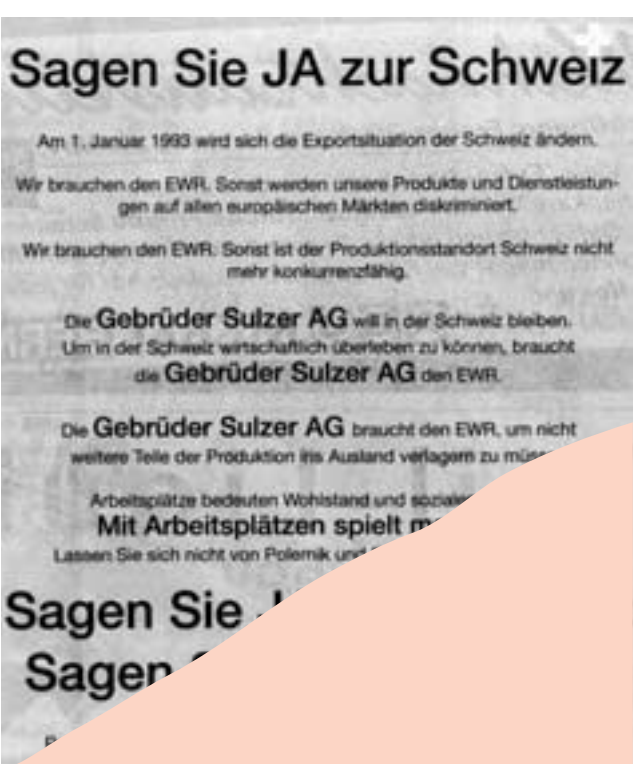
Inserat der EWR-Befürworter 1992

nes Beitrittes zur EU deutlich verändert werden müsste. In seinem Integrationsbericht von 1999 hat der Bundesrat diese Frage denn auch praktisch vollständig ausgeblendet. Die direkte Demokratie auf Bundesstufe wäre aber in gewissen Teilen mit den Vorgaben der EU kaum vereinbar. Man muss sich nur vorstellen, über welche Vorlagen das Schweizer Volk in den vergangenen Jahren abge-