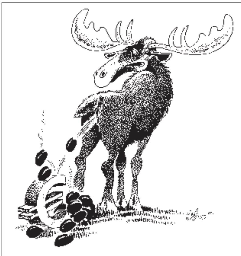
Neulich in Schweden!

Die Einführung des Euro hat somit zum langen Anhalten der Stagnation beigetragen. Professor Socher geht davon aus, dass die «Konjunkturausschläge im Euro-Gebiet in Zukunft noch stärker werden, weil die Gleichschaltung der Geldpolitik zu einer Angleichung der Konjunkturen beitragen wird.» Vor Einführung des Euro hätten die unterschiedlichen geld- und konjunkturpolitischen Massnahmen in den einzelnen Ländern gegenläufige Konjunkturphasen zugelassen und damit insgesamt die Ausschläge der europäischen Konjunktur geglättet, stellt Socher fest.