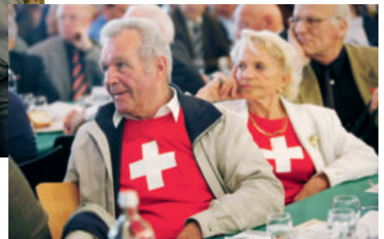
Impressionen von der Mitgliederversammlung 2009