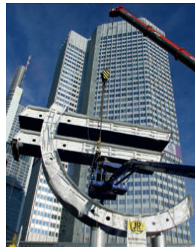
Die Konstruktion Euro ist ein Flopp!

Die Schweizer Wirtschaft ist es gewohnt, mit einem starken Franken zu leben und ist bisher sehr gut gefahren. Trotz immer stärkerem Franken nahmen die Exporte Jahr für Jahr zu. Von einer stabilen und starken Währung träumt auf der ganzen Welt jede Regierung. Schweizer Unternehmen werden sich hüten, in ein schwaches Euro-Land umzusiedeln, es wäre ein grosser Fehler, welchen sie sofort teuer zu bezahlen hätten.