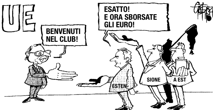
Scambio di cortesie